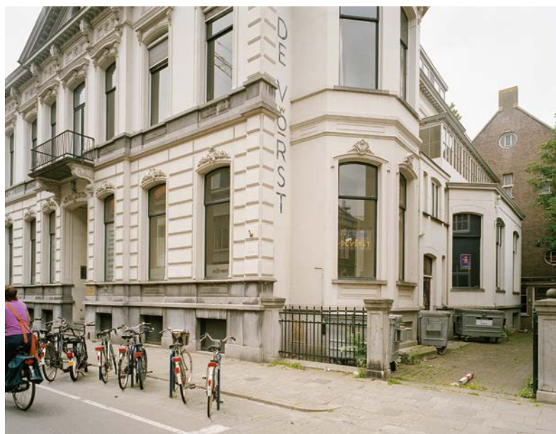
Gevel Willem II-straat 47 in Tilburg. S. Technau 2006

In ons wisselvallige klimaat hebben we behoefte regelmatig even naar buiten te kijken om de lucht te checken – zelfs al kan dat tegenwoordig met een appje op de smartphone. Moet ik zo direct en paraplu meenemen of kan ik zonder? Een erker helpt dus om de blik naar buiten te verruimen en een gevoel van controle te hebben. Een bijkomend voordeel is dat een erker extra licht in de aangrenzende ruimte binnen laat.